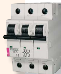
Ogranicznik mocy umownej ETIMAT T